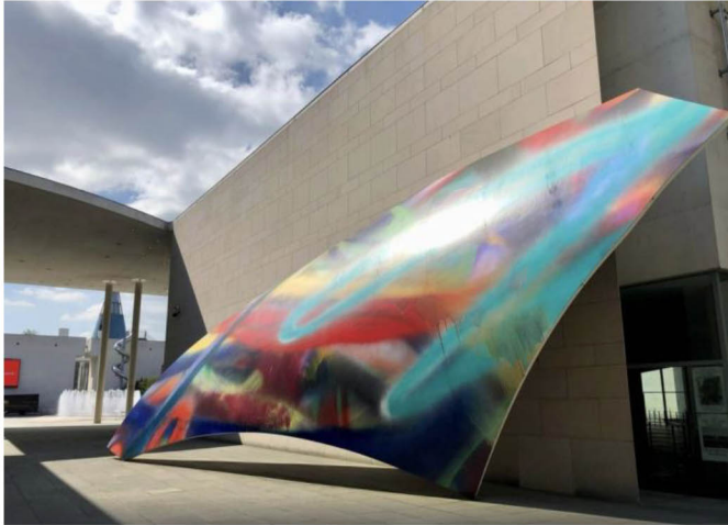
Katharina Grosse. In seven days time. 2011 Spraymalerei, Kunstmuseum Bonn